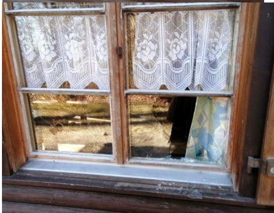
kaputt geschlagene Scheiben