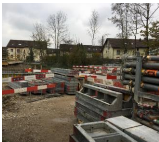
Stand der Arbeiten: 21.11.19

An der ordentlichen Bürgergemeindeversammlung vom 15. Mai 2019 wurde ein Kredit über Fr. 1,9 Mio. gesprochen. Die Planung und die ersten auszuführenden Arbeiten der neuen Holzschntzelheizung kamen gut voran und so begannen Ende September die ersten Bauarbeiten für die neue Holzschntzelheizung. Da das Wetter sehr gut mitspielte, kamen die Arbeiten schnell voran. Standort der neuen Heizung ist zwischen der Kläranlage und Block 11, nördlich der Überbauungen.