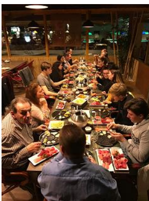
Jungbürger/innen mit Behördenmitglieder im Bowlingcenter

Nach der Rückkehr fand der feierliche Akt im Zunftlokal der alten Gemeindeverwaltung statt. Von insgesamt 14 Jungbürger/innen haben deren 9 am Anlass teilgenommen. Herzlichen Dank an Regula Keller für die Organisation dieses Anlasses.