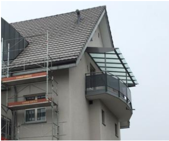
Neue Überdachung Südseite

Das Wetter und die Jahre haben dem Haus am Niederhofweg 5 arg zuge- setzt. Aus diesem Grund hat sich der Bürgerrat dazu entschlossen das Ge- bäude aussen zu sanieren und zusätzliche Überdachungen, vor allem im obersten Stock, anzubringen. So können unsere Senioren auch bei Wind und Wetter den Balkon geniessen. In absehbarer Zeit wird die Sanierung abgeschlossen sein.