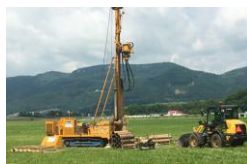
Impressionen der Bohrungen