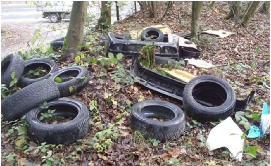
Abfalldéponie im Wald

In solchen Situationen sind wir für jeden Hinweis aus der Bevölkerung dankbar.