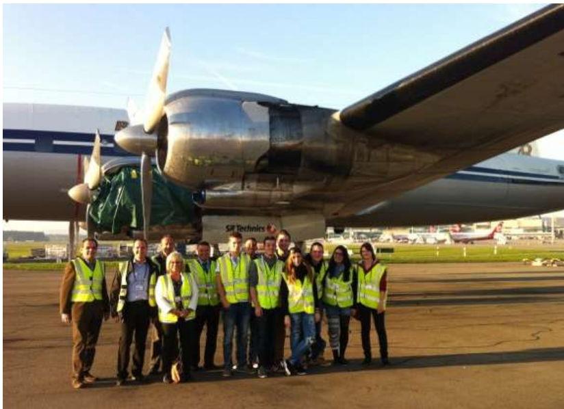
Jungbürger/innen mit der „Super-Connie“

Die teilnehmenden Jungbürgerinnen und Jungbürger hatten sichtlich ihren Spass.