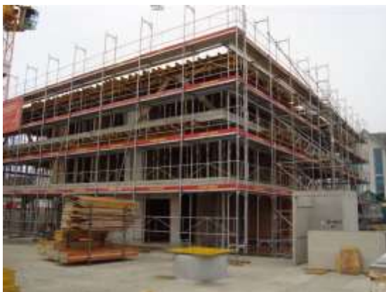
Überbauung „Kirschblüte“, Haus A