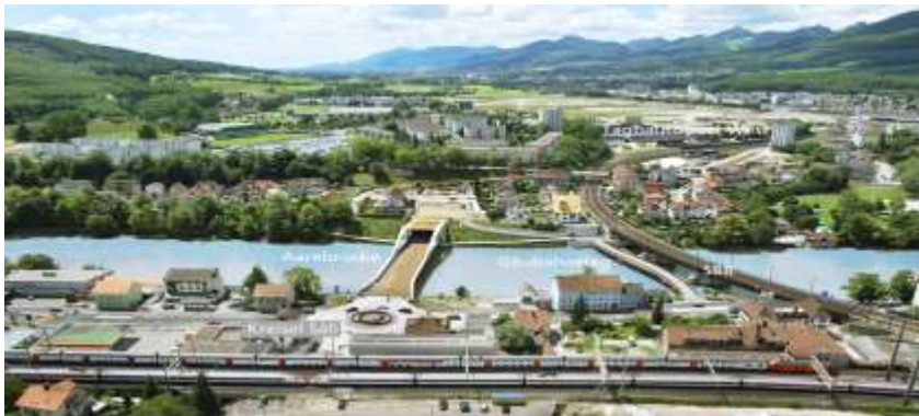
ERO-Aareübergang in Olten

Am Mittwoch, 24. April 2013 findet die offizielle Eröffnung der ERO (Entlastung Region Olten) statt. Aus Gunzger Sicht sind wir ge-