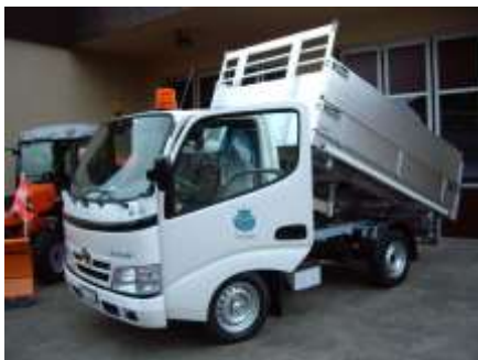
Neu Transporter mit Brücke

Wir haben in dieser Broschüre schon verschiedentlich über die Beschaffung eines neuen Gemeindefahrzeugs berichtet. Nun ist es soweit. Die Werkkommission hat verschiedene Fahrzeuge evaluiert und der Gemeinderat hat aus den Vorschlägen das passende Fahrzeug ausgewählt. In Zukunft werden die Werkhofmitarbeiter einen Kommunaltraktor und ein Transportfahrzeug zur Verfügung haben. Der Kommunaltraktor deckt den Winterdienst (pflügen, salzen, splitten) und die Pflege der Grünflächen ab. Für Transporte (Robidog- und Abfalltouren, Kontrollarbeiten, Unterhalt Bäche, Wasserversorgung, Kommissionen, etc.) steht nun auch ein geeignetes Fahrzeug zur Verfügung.