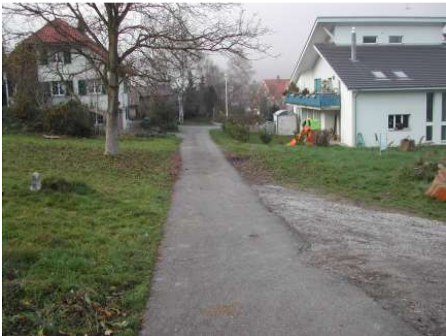
Bild: Die Abbildung zeigt die heutige Verbindungsstrasse Römerweg – Ghölstrasse und die Abzweigung zur neuen Liegenschaft.

Die Gesamtkosten für den Strassenbau (inklusive Landerwerb) belaufen sich auf Fr. 524'500.--. Daran müssen sich die Grundeigentümer mit einem Erschliessungsbeitrag (Perimeter) im Umfang von 80% oder Fr. 419'600.-- beteiligen. Der Nettoaufwand für die Gemeinde beträgt somit noch 20% oder Fr. 104'900.--.