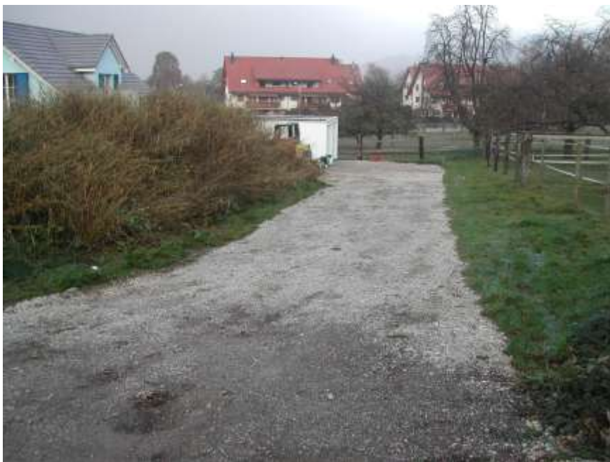
Bild: Die Abbildung zeigt die provisorisch erstellte Strasse zur neuen Liegenschaft an der künftigen Bornstrasse.

Die Kosten der Kanalisation werden über die Spezialfinanzierung «Abwasser» abgerechnet.